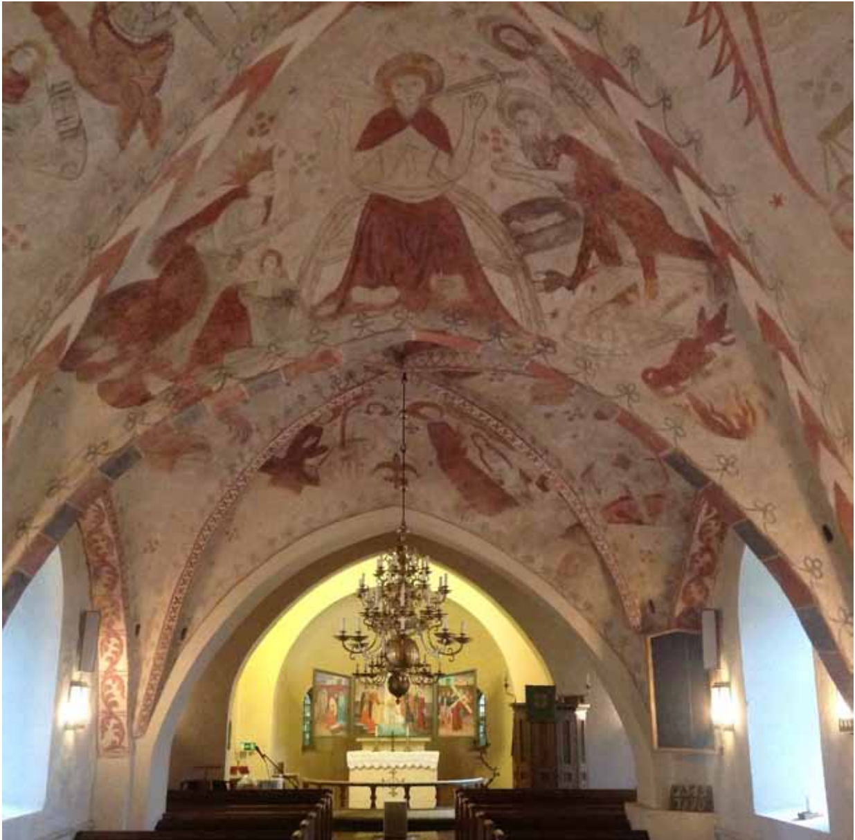
I närmsta valvet syns Yttersta domen.

Många av kyrkans inventarier förstördes, men en oväntad och positiv följd av katastrofen blev att värmen från branden fick kalken att spricka och åter blottlägga takmålningarna. Denna gång valde man att restaurera och konservera de unika verken, och det är så ni kommer att se dem vid ert besök. Skapelseberättelsen, syndafallet, yttersta domen och de sju dödssynderna är bara några av innehållen i bildsviterna.